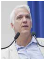
JÉRÔME DE SÈZE